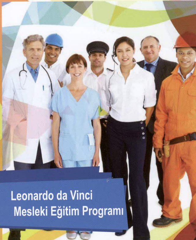
Leonardo da Vinci Mesleki Eğitim Programı