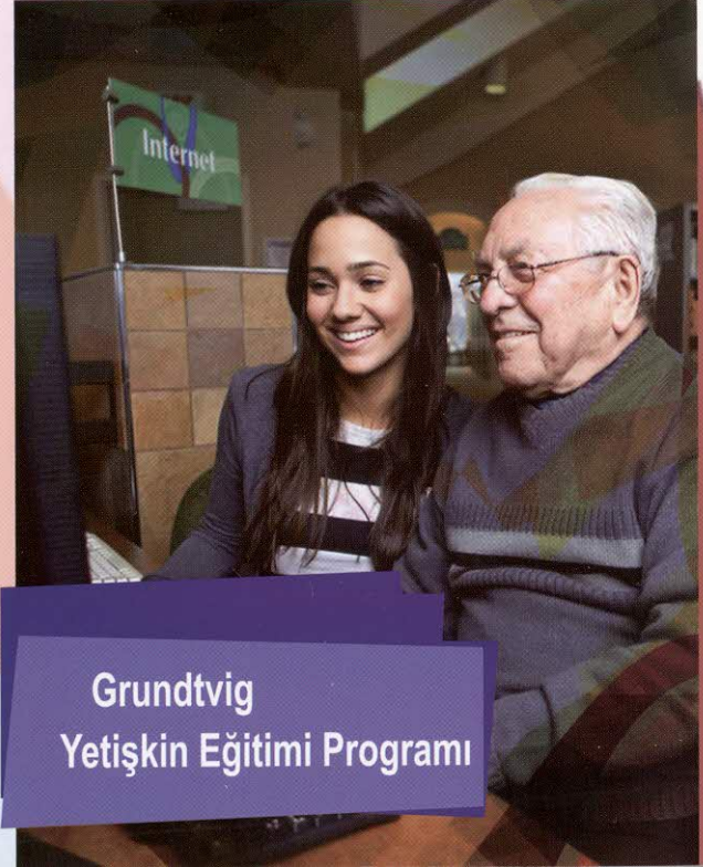
Grundtvig Yetişkin Eğitim Programı